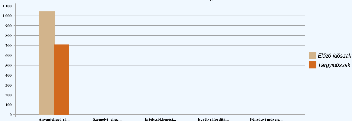
Ráfordítások alakulása és megoszlása